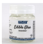
PME Eetbare Lijm Petal Glue 60g