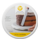
Wilton Draaiplateau Basis