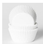
House of Marie Baking Cups Wit pk/48