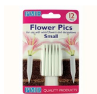
PME Bloemenprikker Klein pk/12