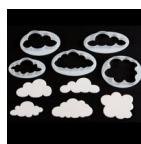
FMM Uitsteker Wolken