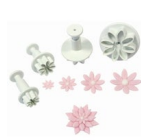
PME Plunger Uitsteker Madelief/Margriet set/4