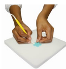
PME Flower Foam Pad