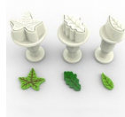
Dekofee Mini Plunger Uitstekers Blaadjes set/3