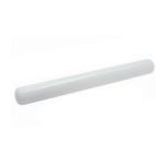
PME Plastic Deegroller 22,5cm