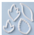
FMM Uitsteker Blad