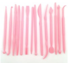
Dekofee Modelling Tools Mini pk/14