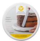
Wilton Draaiplateau Basis