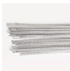
Culpitt Floral Wire Zilver 24 Gauge set/50