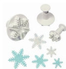
PME Plunger Uitsteker Sneeuwvlok set/3