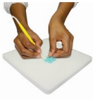
PME Flower Foam Pad